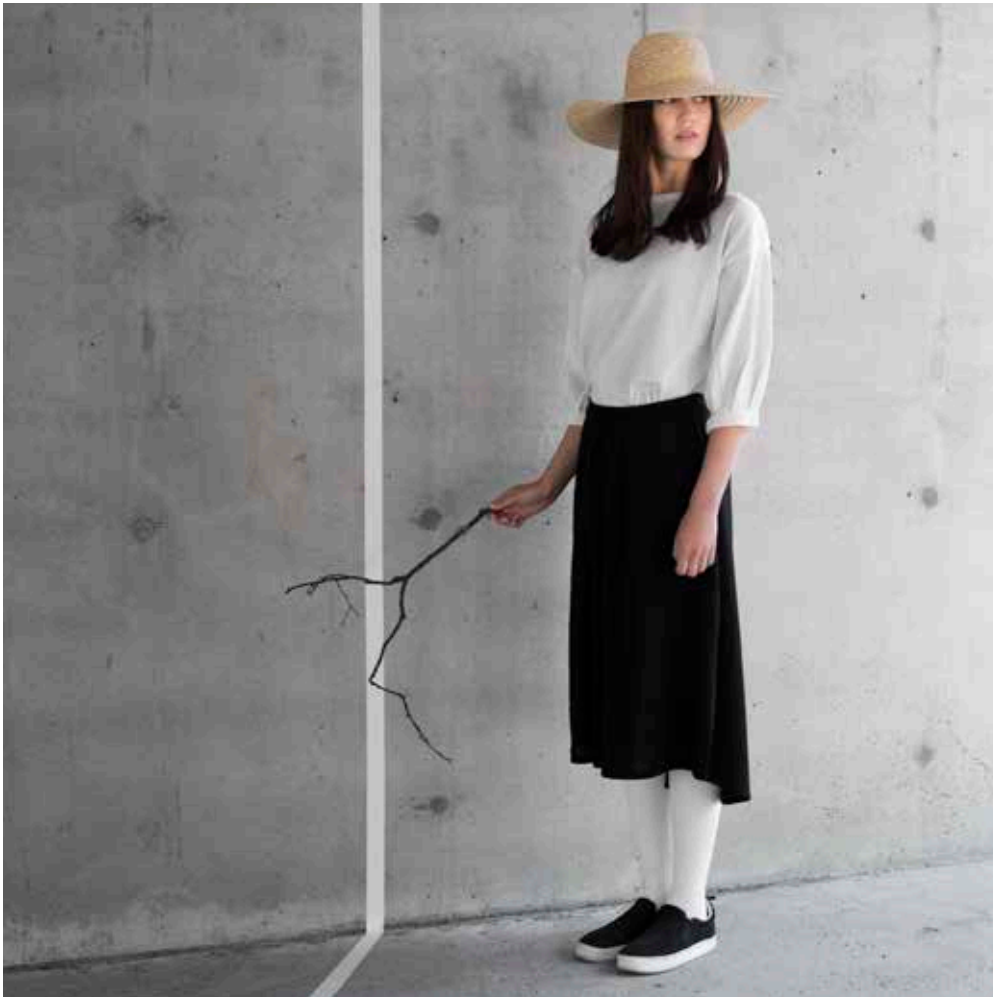
Luoto Shirt, white or black Chemise, blanche ou noir